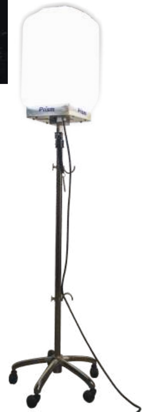
PIE TELESCÓPICO CON RODINES Altura básica : 1.34 m Altura extendida : 2.43 m Diámetro trípode : 0.48 m Peso : 12 kgs / 26.5 lbs Ruedas : 5 / 3 con bloqueo Acabado : Níquel y recubierto de polvo