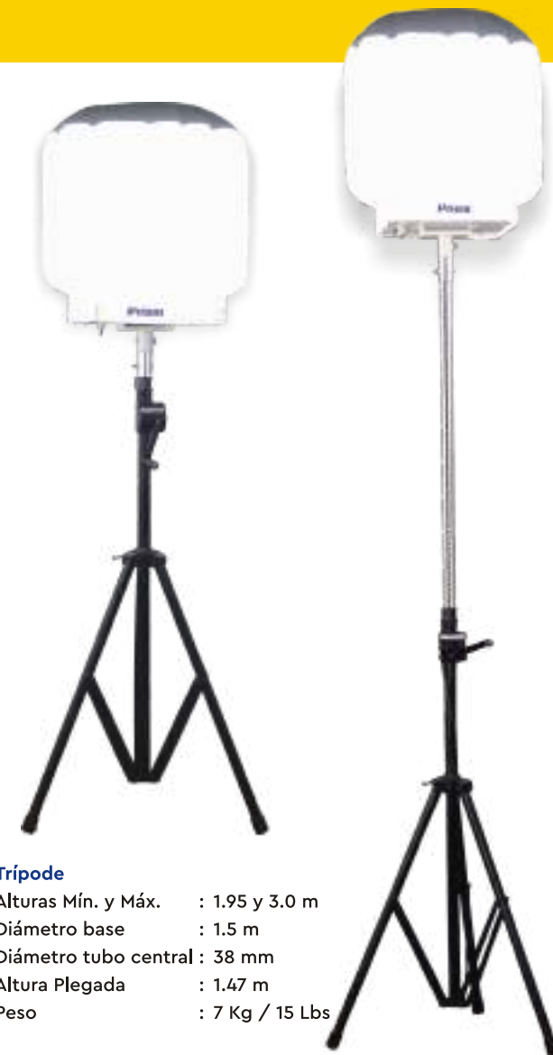
Trípode Alturas Mín. y Máx. : 1.95 y 3.0 m Diámetro base : 1.5 m Diámetro tubo central : 38 mm Altura Plegada : 1.47 m Peso : 7 Kg / 15 Lbs