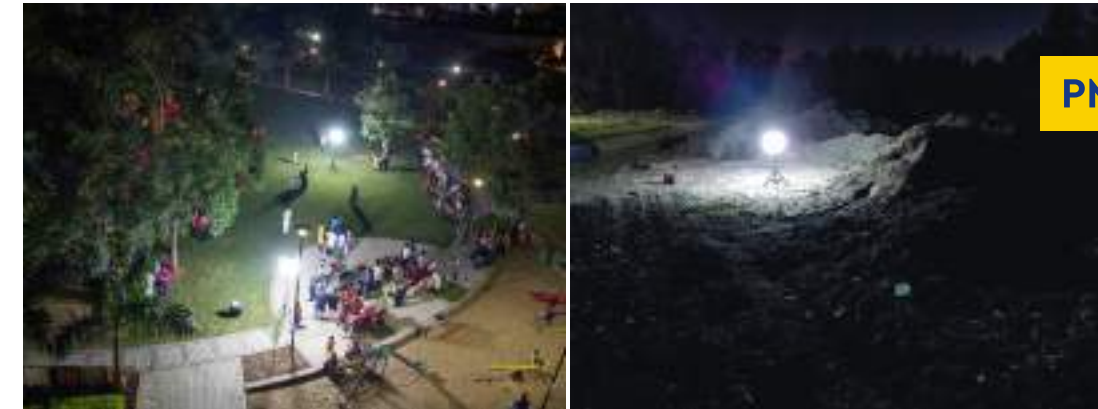
PMBL LED 100/160 Watts